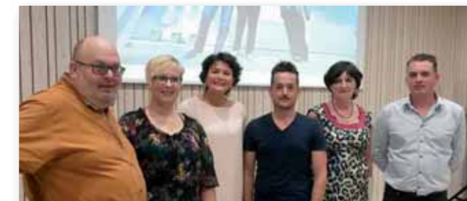
Sabien mee op de foto met het vernieuwd bestuur van Open Vld Houthulst. De komende jaren wil het bestuur vooral luisteren naar de Houthulstenaar, en er staan tegen de gemeenteraadsverkiezingen van 2018.