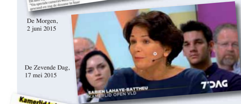
De Zevende Dag, 17 mei 2015