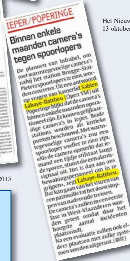
Het Nieuwsblad, 13 oktober 2015