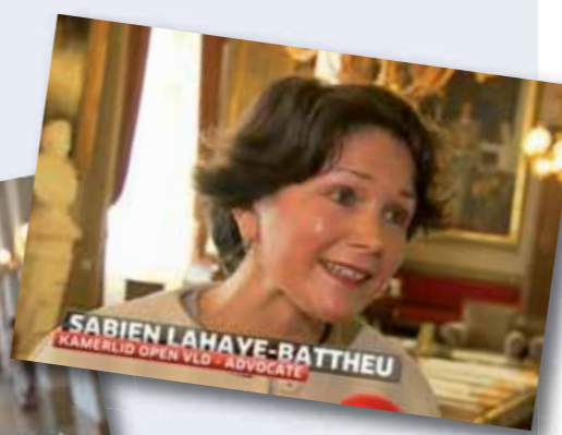
VTM Nieuws, 25 mei 2015