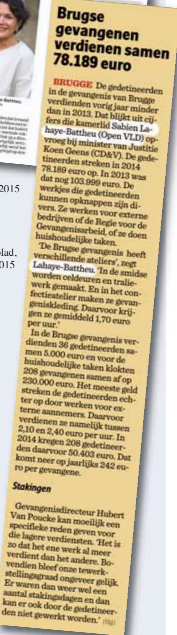
Het Laatste Nieuws, 27 mei 2015