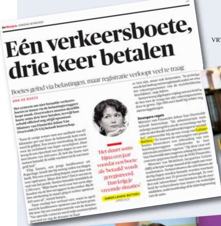
De Morgen, 2 juni 2015