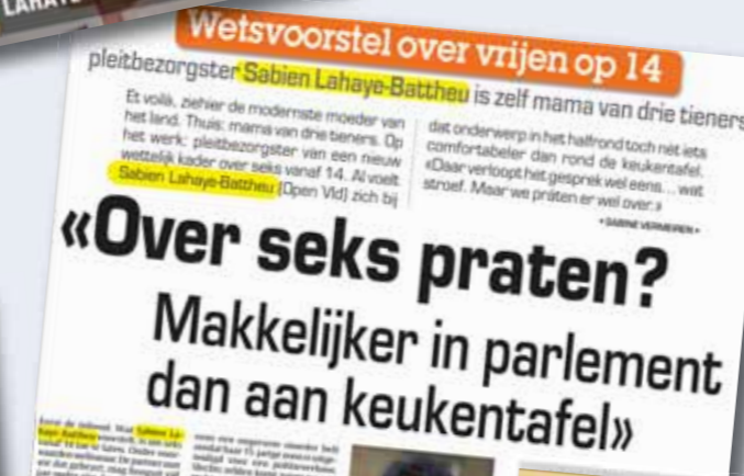
Het Laatste Nieuws, 19 september 2015