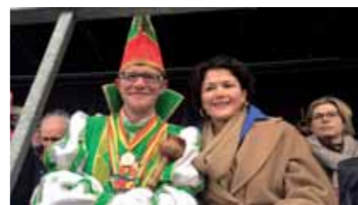
Het eerste weekend van maart baadde Poperinge in de carnavalssfeer .

En het is een top-weekend geworden. Proficiat aan iedereen die heeft meegewerkt om van deze 50e editie een succes te maken!