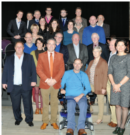
Het bijna voltallige bestuur van Open Vld Poperinge.