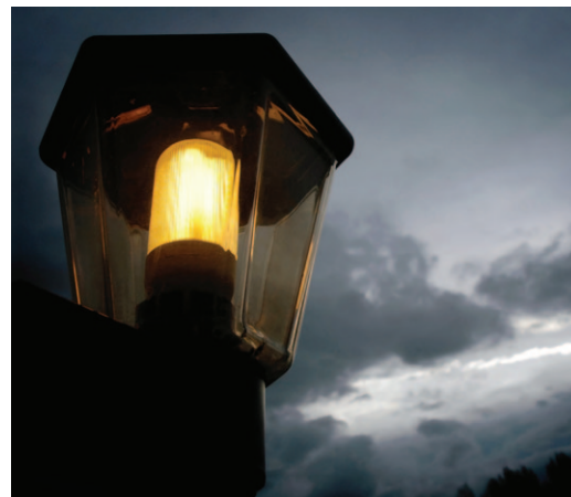
Open Vld pleit voor het doven van de openbare verlichting langs de gemeentewegen én van de verlichting van de openbare gebouwen.