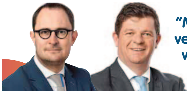
Vincent Van Quickenborne Lijsttrekker Kamer

baar in Poperinge, in de Westhoek. Een eigen wetsvoorstel zorgt er zo voor dat 20.000 Vlaamse "doodlopende" straten voortaan als "doorlopend" worden aangeduid voor fietsers en voetgangers. Dankzij doorgedreven inspanningen is de grenscriminaliteit fel gedaald: in het parlement werd een wet gestemd waardoor slimme camera's ook mobiel kunnen worden ingezet en vijftien politiezones in de grensregio kregen elk jaarlijks 50.000 euro om die aan te kopen. Sabien hoopt ook in de komende legislatuur te kunnen meewerken aan het realiseren van enkele liberale voorstellen. Lees verder op pagina 2.