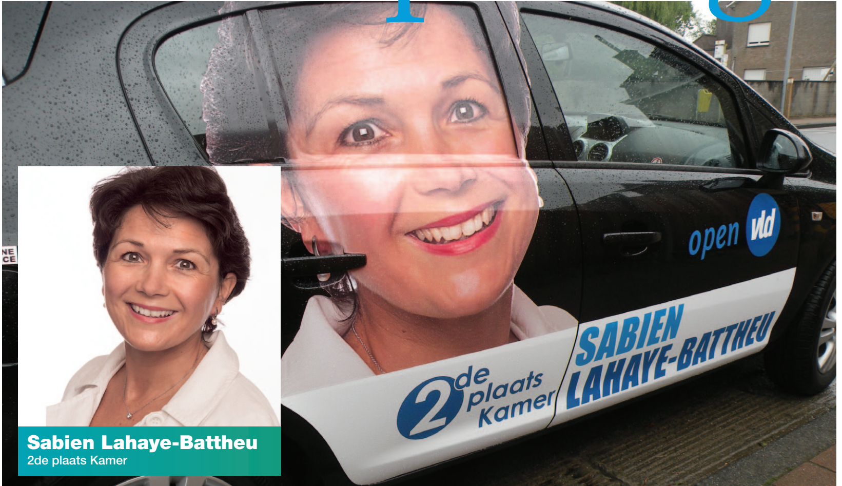
Sabien Lahaye-Battheu 2de plaats Kamer

Op www.sabien-lahaye-battheu.be vindt u alle info over Sabiens activiteiten in Poperinge, de regio en Brussel.